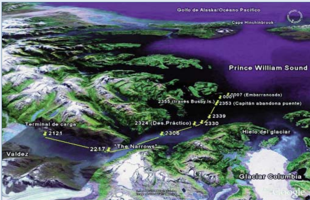
Escenario del accidente: obsérvese la emisión de hielo glaciar desde Columbia Bay, en la esquina inferior derecha (Elaboración propia sobre un mosaico fotográfico "Google Earth" parcialmente modificado)

rra. Razonablemente, las empresas más serias (incluyendo la Exxon) empezaron a embarcar un "chofer" extra y a rebajar de guardia al 1er. oficial pero, tras caer también la Exxon víctima de la epidemia de automatismos, en Marzo de 1989 el "Exxon Valdez" navegaba sin "4º oficial".