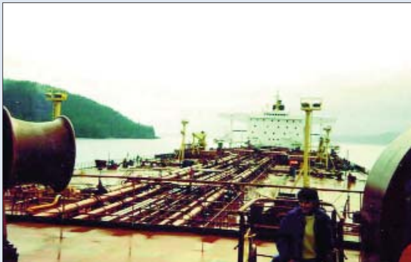
Fotografía obtenida desde el castillo de proa del "Exxon Valdez", casi con seguridad durante su estancia en el fondeadero de Naked Island para efectuar reparaciones provisionales

mantuviera los siguientes cinco minutos a rumbo 180° antes de abandonar la esperanza de que Moisés le abriera un camino entre el hielo y las piedras. Hacia las 0001 y con la luz de Bligh Reef ya abierta unos 30° por la banda equivocada debió ordenar la caída a Er, aunque pudo ordenarla antes si, como alguien sugirió, hubo "perada" del timonel ("when the ship was on autopilot .../..., turning the wheel would have no effect on the rudder"): de una forma u otra el inicio de la caída quedó registrado hacia las 0002.