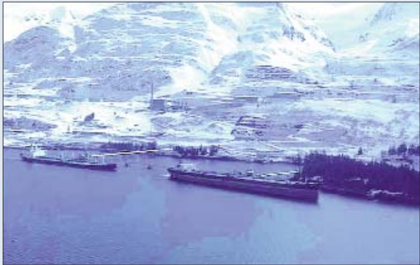
Vista parcial (mitad W) de la terminal marítima de Alyeska en Valdez. El petrolero de la derecha ocupa el mismo atraque utilizado por el “Exxon Valdez” los días 22 y 23 de Marzo de 1989

La construcción de semejante oleoducto a través de territorio ártico supuso la oposición frontal de los grupos medioambientales y tales problemas de ingeniería que llegó a plantearse transportar el crudo a través del Paso del NW en enormes petroleros rompehielos, idea pronto desechada aunque se demostrara factible (¿alguien recuerda el viaje del “Manhattan” en 1969?). El embargo petrolífero de 1973 debió aguzar las mentes y aflojar los bolsillos, porque en 1974 comenzó la construcción del oleoducto y en 1977 ya estaba en servicio como un consorcio de siete petroleras (Alyeska Pipeline Service Co.), participado por la Exxon en un 20%. Alyeska también era responsable de la prevención y limpieza de cualquier vertido en tierra o en el Prince William Sound y, dado el interés ecológico de la zona, se le impuso la disponibilidad permanente de determinados medios humanos y materiales, con un tiempo previsto de respuesta de cinco horas para colocarlos “in situ”. Paralelamente y entre otras medidas, también se estableció un