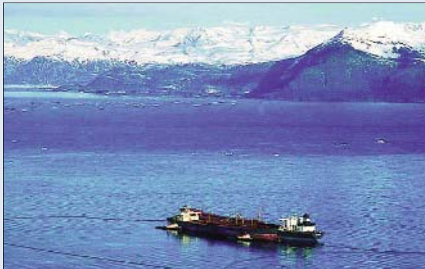
Fotografía obtenida el 26 de Marzo: el “Exxon Valdez” está embarrancado y rodeado de barreras antipolución mientras se trasiega su carga al “Exxon Baton Rouge”, de menor tonelaje y abarloado por su Br (en primer plano). Obsérvese el buen tiempo reinante los primeros días y la presencia ocasional de hielo procedente de Columbia Bay, que debería estar al fondo a la izquierda

Según los datos disponibles la visibilidad estaría aumentando a 10 millas con ligera aguanieve, viento N de 10 nudos, marejada y 0,5° de temperatura. A las 2339 y con el petrolero ya cruzando la zona de separación del dispositivo a unos 12 nudos, Hazelwood ordenó otra caída de 20° a Br hasta el 180° (no notificada a Valdez Traffic) y poner el piloto automático: ahora tenía a unas 5 millas por la proa (25 minutos) el canal sin balizar existente entre Bligh Reef (por su Er) y Reef Island (por su Br). Como se aventuraron hipótesis extrañas aclararé que, aunque para un buque con el calado del “Exxon Valdez” aquel canal tendría un ancho de unos 700 mts, cuatro copas no eran suficientes para que alguien con la experiencia y el conocimiento local de Hazelwood intentara pasar por allí. Su idea era mantener el rumbo hasta tener la luz de Busby Island por el través de Br. (unos 15 minutos) y, entonces, caer a Er. (digamos unos 45°) dejando Bligh Reef por Br.: el 3er. oficial Cousins testificó que Hazelwood habló con él tres veces acerca del cambio de rumbo, preguntándole otras dos si se sentía lo suficientemente “comfortable with the procedure” como para permitirle bajar a su camarote a terminar el papeleo