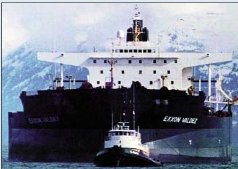
Una vez trasegada su carga y reflotado, el 5 de Abril el “Exxon Valdez” se dirige apreciablemente “hocicado” a fondear en la cercana Naked Island. Obsérvense sus más de 50 metros de manga en proporción con las dos personas del alerón de Er (la “tercera persona” es el repetidor de la giroscópica), así como el sano mosqueo que revela el bote salvavidas de Br arriado hasta su posición de embarque

Para entonces el “viejo” ya había largado al “voluntario” una indeseable hipoteca al pasar la máquina a régimen de mar antes de tiempo, pues normalmente y por razones que sería prolijo explicar aquí, en un mercante el oficial de guardia procura no tocar la máquina salvo en caso de extrema necesidad, y en un superpetrolero cargado tocarla “in extremis” no sirve absolutamente para nada. El caso fue que Cousins no sólo se abstuvo de tocar la máquina sino que, según el “course recorder”, durante unos seis minutos a partir de las 2355 tampoco tocó el timón y el “Exxon Valdez” continuó a rumbo 180, posiblemente gobernado por el piloto automático: el porqué ha sido objeto de explicaciones contradictorias. Cousins declaró haber ordenado pasar el gobierno a manual y meter 10° de caña a Er un minuto después de las 2355, pero enfrentado a la gráfica que indicaba que la caída no se había iniciado hasta las 0002 se quedó sin argumentos (“I’ve studied the course recorder for a long time, and I really don’t have an adequate answer for that”). Según la prensa, el NTSB, que había estudiado a fondo sus horas de sueño, le ofreció un argumento alternativo (“... asked if he could simply have lost track of time for a few minutes” .../... “No, No, Cousins insisted”); en mi opinión es harto improbable que en una situación de estrés Cousins se quedara traspuesto: otra cosa es que se