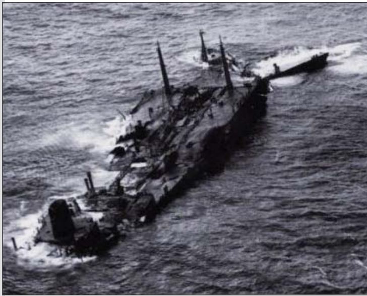
Pequeños incendios en el agua tras el bombardeo aeronaval.

cambiaba la palanca de su posición de proa (“gyro” o “control”) a la central (“hand”) y se gobernaba con la mini-caña. La posición de popa (“aux”) activaba un sistema de emergencia que no viene al caso. Con ínfimas variaciones según el buque, éste era el dispositivo con el que el Capitán, puentando al timonel, gobernó personalmente el “Torrey Canyon” hasta las 0842, y aquí va a ser difícil que alguien tire la primera piedra al “viejo”, porque somos legión los que, como opción más fiable, le hemos dado a la ruedecita de lo lindo.