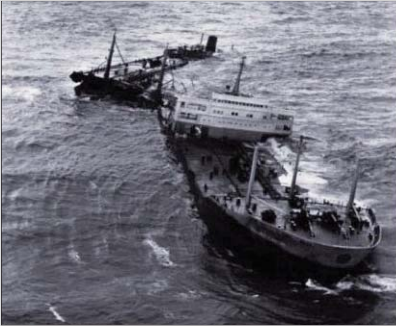
: El "Torrey Canyon" tras partirse en dos.

Cerros de Ubeda o, simplemente, prefieran ver la película sin sufrir el cine-forum, sepan que éste artículo es "interactivo" y que pueden saltarse sin más el siguiente capítulo.