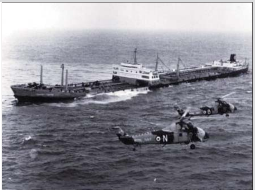
El "Torrey Canyon" poco después de embarrancar en las Scilly.

Como había dado todo tipo de facilidades para ello, en la inevitable búsqueda de un culpable resultó fácil crucificar al Capitán, por lo que la conclusión del oportuno Comité fue que "... the Master alone is responsible for this casualty" . Claro que dos de sus tres miembros eran un Ingeniero Naval y un Jurista. Cinco años después, y tras un