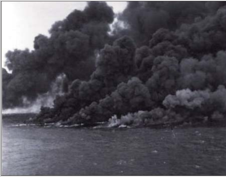
Pequeños incendios en el agua tras el bombardeo aeronaval.