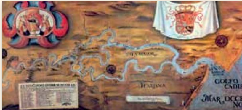
Ría del Guadalquivir

Al describir a los pilotos de río , menciona, que estaban regulados por ordenanzas aprobadas por los Reyes Católicos , y cuando cita a los pilotos de la barra de Sanlúcar , hace una particular apostilla, diciendo que inicialmente eran nombrados