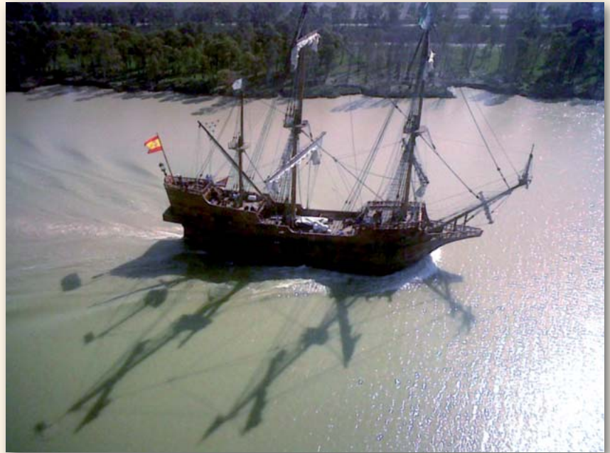
Galeón Andalucía por el río.

Aunque no eran tan frecuentes, si eran posibles las salidas nocturnas, pues los pilotos prácticos empeñados, posicionaban en los lugares con-