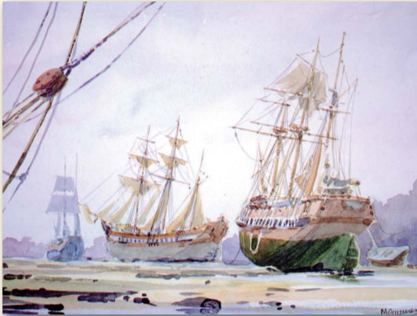
Fragatas carenando en la Horcada, acuarela de M. Camarero

de la barra con embarcaciones de calados próximos al límite permitido en cada marea, ante circunstancias de caída significativa, por ejemplo al recalar mar tendida del SW. Esta limitación por caída, era aún más de tener en cuenta en las salidas que en las entradas, y fueron agravándose a medida que las carabelas y navíos, aumentaban su porte, el cual por cierto, desde los romanos hasta el siglo XV apenas variaron, pero desde el descubrimiento de América, el prototipo de buque de 100 tn, que se mantuvo hasta entonces, fue aumentando para pasar a 150 a mediados del XVI, continuando aumentando hasta que pasado de 600 tn de desplazamiento, se tuvo que proponer como solución para continuar pasar la barra y arribar a Sevilla con seguridad, que por su construcción, fuesen los navíos menos enquillados, de modo que al igual que entonces construían los holandeses, fuesen naves más planudas, es decir menos enquilladas su obra viva.