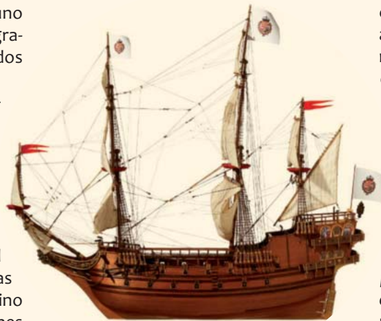
Galeón Apostol Felipe

por el duque de Medina Sidonia, y cobraban altísimos estipendios a los maestros y capitanes de naos por meter y sacar éstas por la barra.