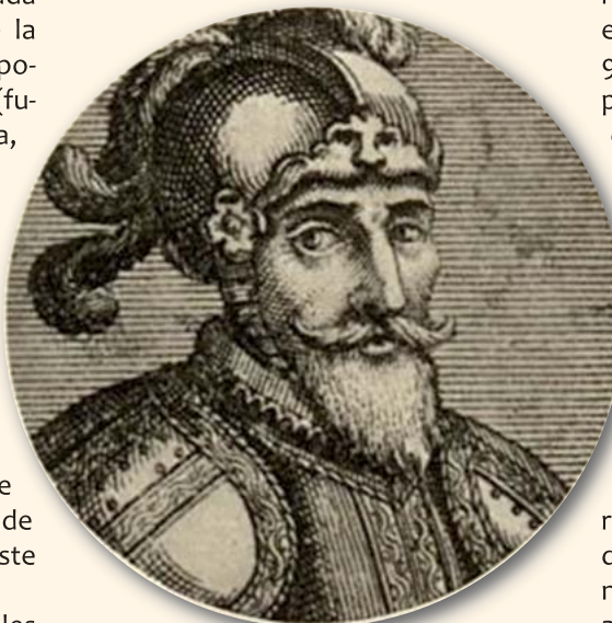
Grabado de Pedro Arias Dávila

uno de los pilotos, (posiblemente por llevar en compañía -estar asociados-, la explotación del servicio de practicaje de la barra), así cita que por sacar las primeras ocho naves de la Flota de Pedrarias , se pagaron por el lemanar la primera vez, el 26 de febrero de 1514, 1828 maravedíes, (una media de 228,5 mrds. por nave), al tiempo que las restantes embarcaciones, -quizás por ser de menores portes-, salieron sin practico en pos de las otras.