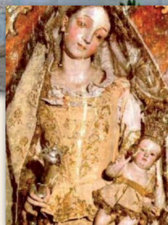
Santa Maria de Barrameda (Replica conservada en el palacio de Arizon)