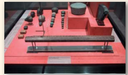
Codo real egipcio( Museo del Louvre)

Era habitual que estos pilotos usaran el propio cordel de su sonda, ajustada desde el codo a la mano,