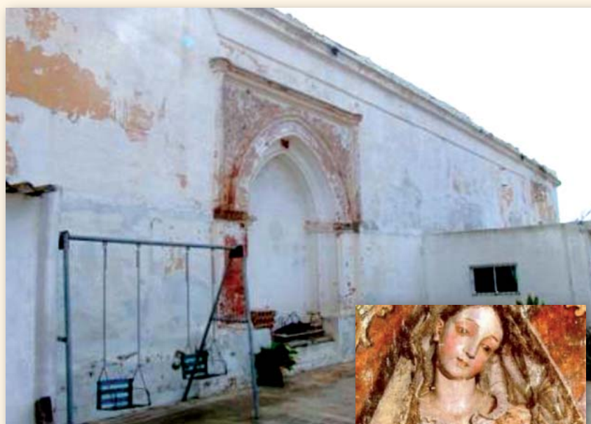
Portada y últimos restos del antiguo monasterio San Jeronimo

Con el numero 1 se sitúa el Monasterio de los Jerónimos, antigua ermita dedicada a Santa Maria de Barrameda, (barra-me-dá), establecida por los templarios en 1270 en un lugar estratégico de la desembocadura del Guadalquivir, pues por su elevación sobre una loma no muy alta pero con una visión directa y clara de la entrada, ha sido una marca de referencia para aproar al lugar que mas calado tuvo y tiene, el cauce natural del Guadalquivir. Fue esta ermita, una base de apoyo de estos caballeros que acompañaron al rey don Fernando en la toma de Sevilla. En el siglo XIV, cuando a los templarios se le extinguieron su militar religión, quedó bajo la posesión de don Juan de Guzmán, señor de Sanlúcar, pasando a ser prisión a la cual mas tarde se le adoso un convento con hospicio o casa de apeadero, Durante el siglo XV se convierte en monasterio y residencia de recuperación de los Jerónimos sevillanos, (popularmente llamados isídro s por intentar formar una nueva orden dentro de la general) pues era entonces la zona donde se ubicaba este monasterio, un paraje con un frondoso pinar donde se recibían directamente los aires frescos y