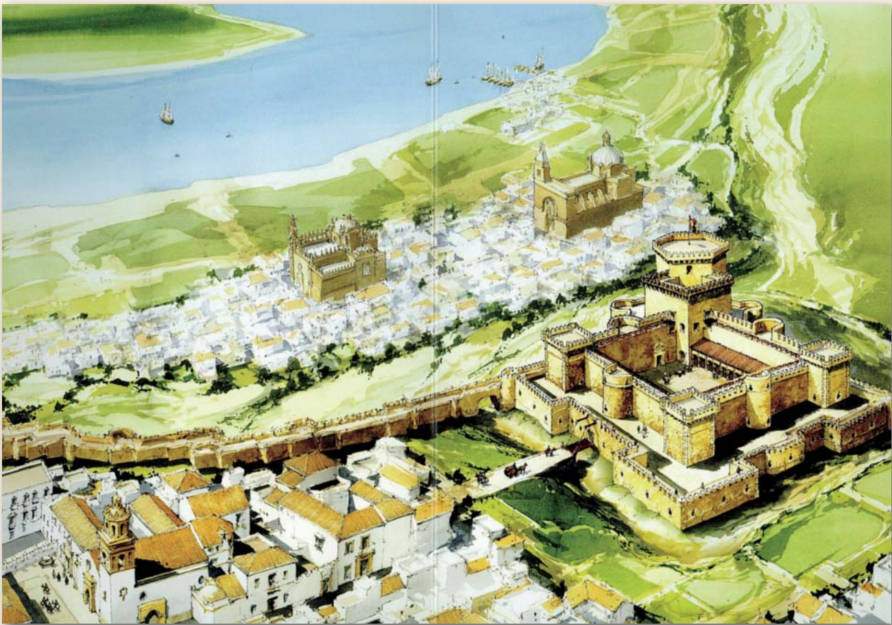
Tres marcas de tierra, para pasar los canales de la broa sanluqueña a partir del siglo XV hasta el siglo XVIII. Castillo de Santiago. Iglesia de Santo Domingo y convento de San Francisco

años 70 logró ocultar estas ruinas y la especulación urbanística posterior, arrasó los últimos muros que permanecieron útiles a los navegantes mas de seis siglos, testigos y protagonistas pasivos de tanta historia marítima española por el buen apoyo como marca de tierra que ofreció a los pilotos prácticos y a la seguridad marítima de esta última parte de la barra sanluqueña. Como testimonio de tan histórica marca, considerada como la más antigua de cuantas balizaron el Guadalquivir, a excepción del antiguo faro de Chipiona (que siete siglos sirvió), se reproduce la puerta del monasterio antes de su destrucción y un dibujo de su conjunto.