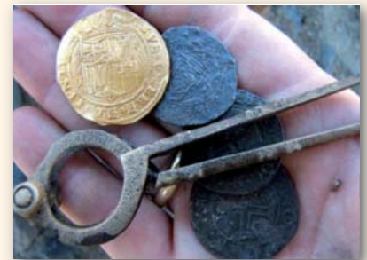
Monedas de oro y plata halladas en un naufragio

venientes, algunos botes con antorchas encendidas para marcar la canal practicable, por carecer el entorno de balizamiento y no poder observar las marcas de tierra, (ver anexo-2, sobre algunas de las principales marcas diurnas desde el siglo XIII al XVIII).