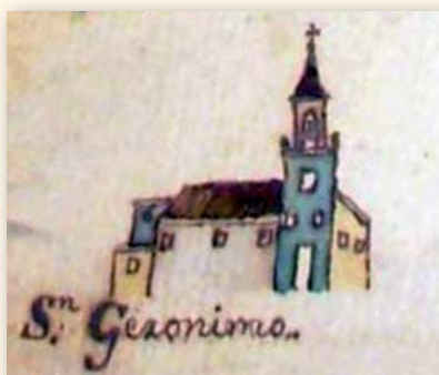
Monasterio de San Jeronimo, detalle plano cargaderos Guadalquivir.

yodados de la brisa marina, restableciéndose de nuevo la advocación de Santa Maria de Barrameda, virgen de gran arraigo en las dotaciones de las expediciones a América desde los primeros viajes, pues aquí acudían antes de partir, Colón, Magallanes y tantos otros, que casi a diario asistían a misa en tan renombrada ermita-monasterio, mientras sus naves permanecían en el fondeadero-surgidero de Bonanza, en espera de las condiciones precisas para partir. Fue también conocido este monasterio por tener un manantial de agua potable muy apreciada por los navegantes de la Carrera de las Indias , en donde llenaban sus toneles y botas, por tardar muchos meses en descomponerse.