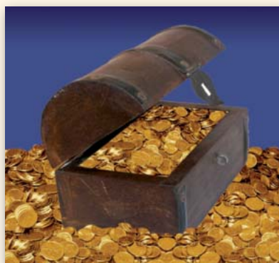
Arcón de transporte de caudales

Cabe recordar la especial dedicación, entrega y responsabilidad con la que superaban los pilotos prácticos de esta barra, las dificultades y variables físicas del propio entorno, infectado de bancos de arenas y fangos, rodeada de numerosos bajos y restingas, en donde convergían la acción de las mareas, sus corrientes, vientos y visibilidad necesaria para afrontar tal paso con éxito, pues tal como se decía en la época: